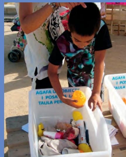
Figura 3. Caixa amb els objectes que els participants han de classificar.