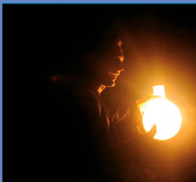
Figura 7. «Sol dins d'una ampolla».