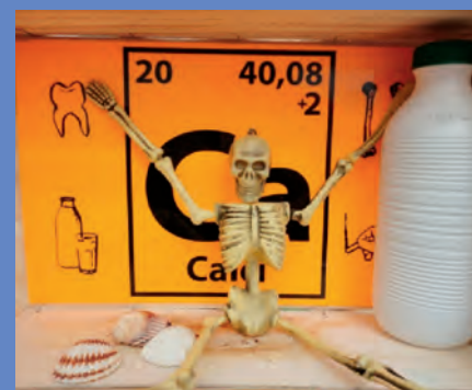
Figura 4. El calci es troba tant als ossos com a la llet.

Es va dissenyar La vida secreta dels elements amb la idea de donar un punt de vista global de la relació entre la química i la societat i amb l'objectiu de despertar vocacions científiques