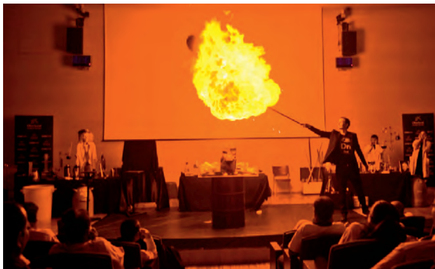
Figura 1. Explosió d'un globus d'hidrogen.

cognició. La nostra feina ha de ser complementària i ha d'anar encabida dins de l'aprenentatge no formal. Per tant, les eines que es fan servir per ensenyar i estimular la ciència són l' experimentació interactiva , les paradoxes cognitives , la creativitat científica , el pensament lateral i l' efecte viral .