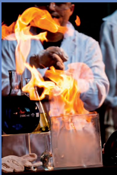
Figura 8. Una reacció de combustió.

sòlid al qual pertany, de manera que l'espectador participa a l'espectacle des del primer moment. Aquest acte interactiu és el primer de molts que es duen a terme durant tot l'espectacle, que aborda temes com la diferenciació del que és i el que no és una reacció química, la conservació de la massa, la reactivitat de les substàncies i les aplicacions de la química a la indústria i a la natura.