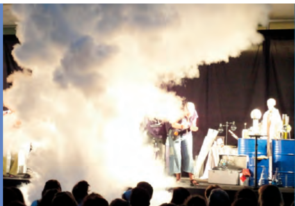
Figura 9. L'espectacle final.

És llicenciat en ciències físiques per la UB, té estudis del màster en història de la ciència i la societat de la UAB i ha fet nombrosos cursos de divulgació científica. Ha treballat al CosmoCaixa, TV3, Catalunya Ràdio, TVE, ComRàdio, el diari Avui o la revista El Temps . Fa cinc anys va fundar i dirigeix l'empresa Creaciència – Experimentàlia, especialitzada en la divulgació de la ciència i el medi ambient. L'activitat principal de l'empresa són els espectacles en centres educatius (més de cent anuals), a banda d'exposicions en museus, tallers i experiments massius. És autor de dos llibres, Ciència a un euro i Ciència a dos euros , amb més de quinze mil exemplars venuts. A. e.: dani@experimentalia.es