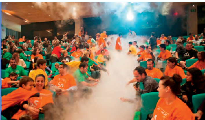
Figura 5. L'espectacle Quim i Ka.

L'espectacle comença provocant l'expectació del públic en fer dos experiments plens de llum i so: «Flaix blau» i «Sol dins d'una ampolla». Immediatament després, es presenten (fig. 7) l'espectacle i l'equip i es procedeix a la identificació dels elements i el seu estat físic. Cada persona del públic fa un crit segons l'estat