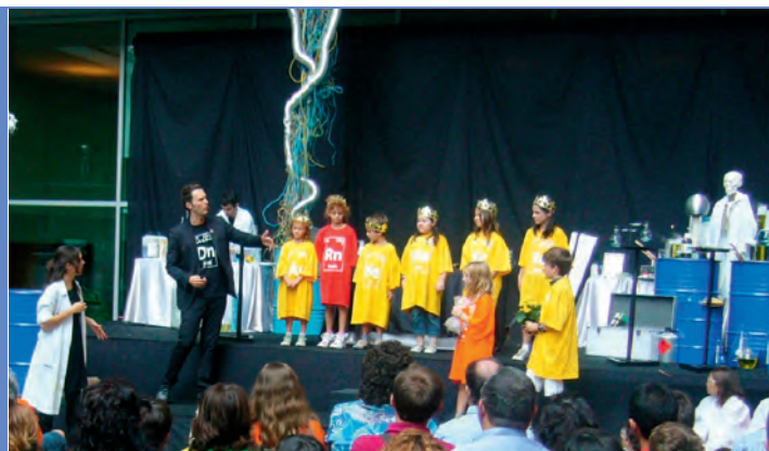
Figura 6. Els voluntaris amb les corresponents samarretes i corones.